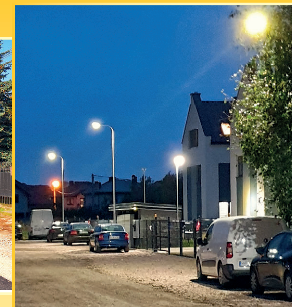
Przy ul. Kozackiej świecą nowe LEDy