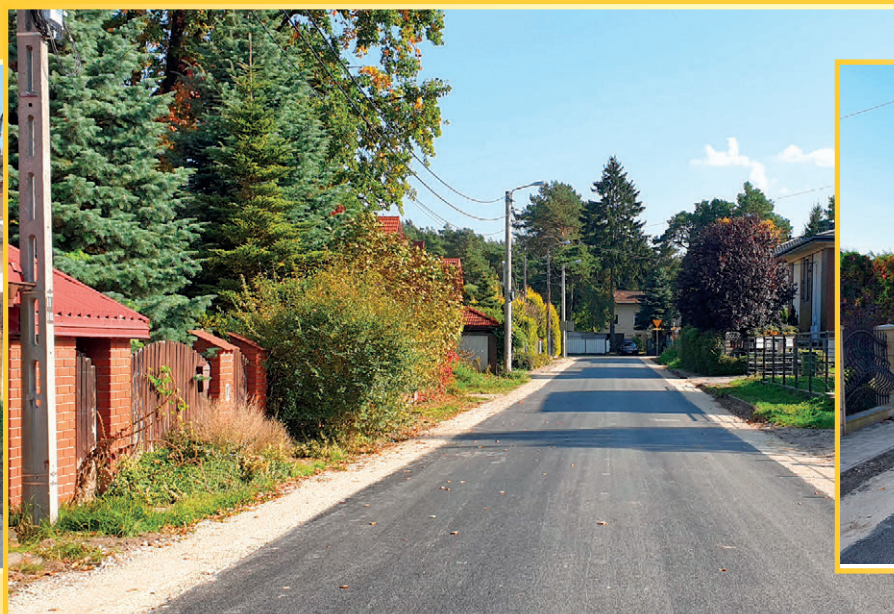
Ulica Maratońska równa niczym stolnica