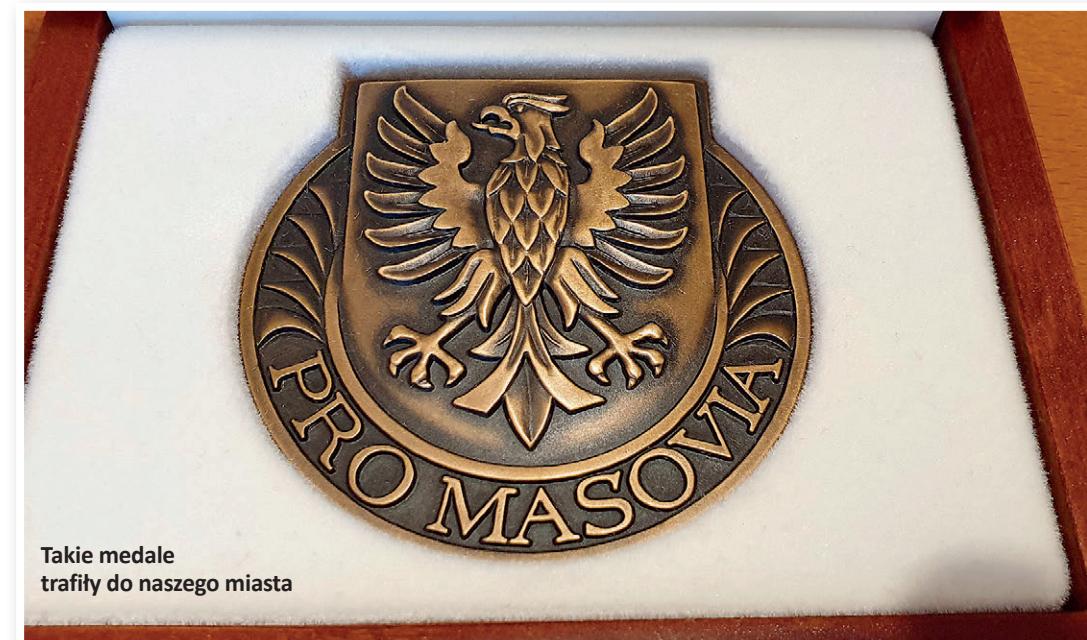
Takie medale trafiły do naszego miasta

Medal Pro Masovia otrzymała również Szkoła Podstawowa nr 5. Okazją ku temu jest szczególna. W tym roku obchodzimy bowiem stulecie edukacji na Strudze, którą w 1921 r. zainaugurowała jednoklasowa Publiczna Szkoła Powszechna w Czarnej