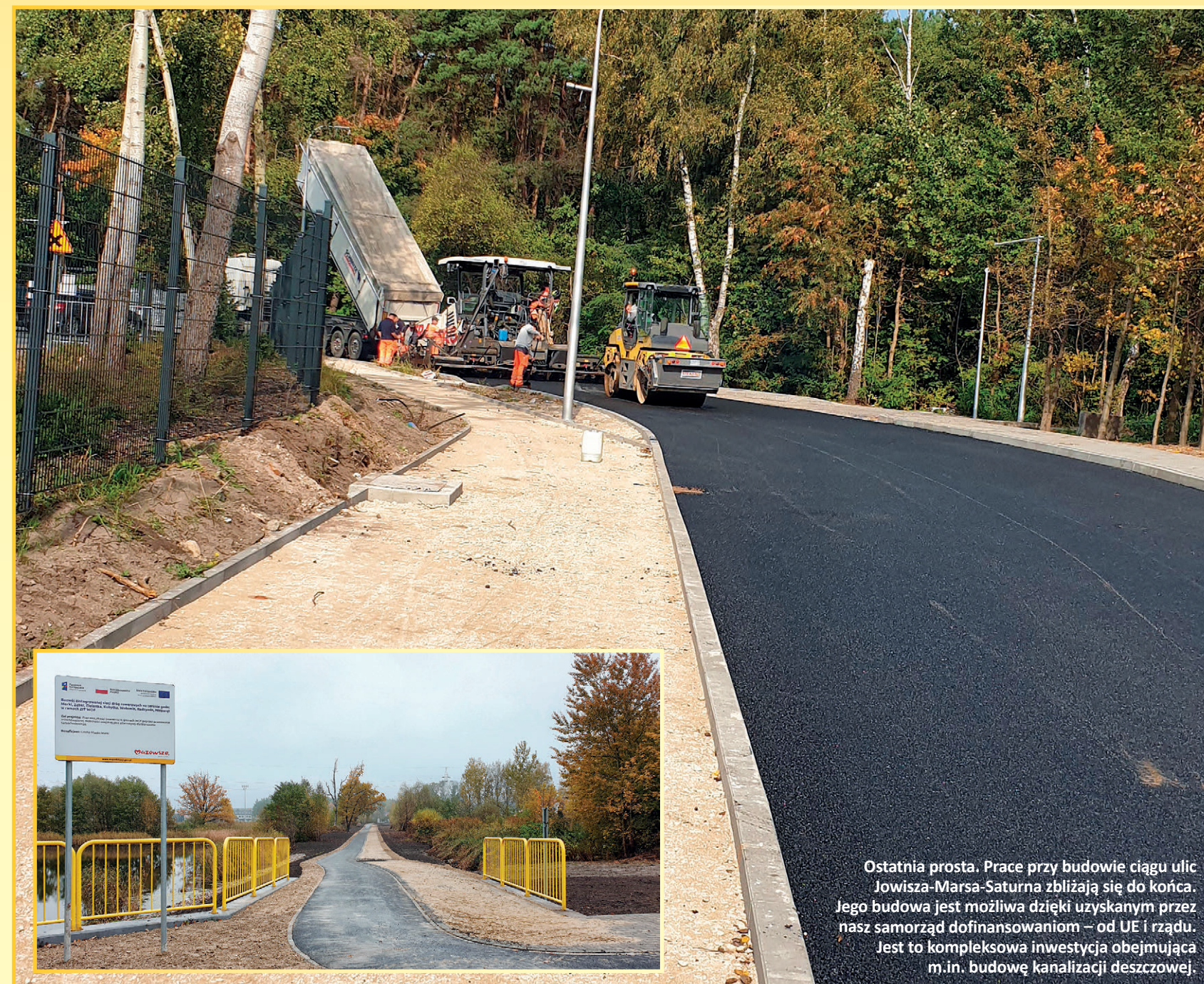
Ostatnia prosta. Prace przy budowie ciągu ulic Jowisza-Marsa-Saturna zbliżają się do końca. Jego budowa jest możliwa dzięki uzyskanym przez nasz samorząd dofinansowaniom – od UE i rządu. Jest to kompleksowa inwestycja obejmująca m.in. budowę kanalizacji deszczowej.

Poprawiliśmy bezpieczeństwo pieszych przy ul. Wspólnej. Zrewitalizowaliśmy m.in. przejścia dla pieszych: przy Brzozowej, Zabawnej i Srebrnej. Pojawiły się przy nich m.in. koczki ostrzegające kierowców. Zmieniliśmy również oznakowanie poziome i pionowe, wprowadzając znaki stop przy wjeździe z bocznych ulic.