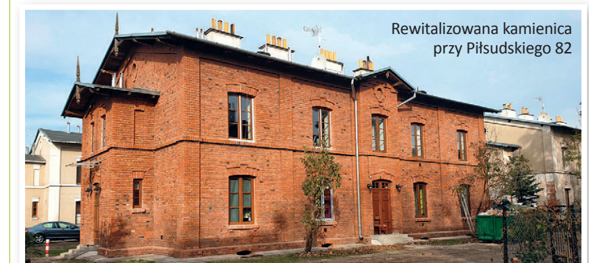
Rewitalizowana kamienica przy Piłsudskiego 82

Otrzymamy pieniądze z puli rządowej. Dzięki temu zrewitalizujemy 8 kolejnych zabytkowych obiektów.