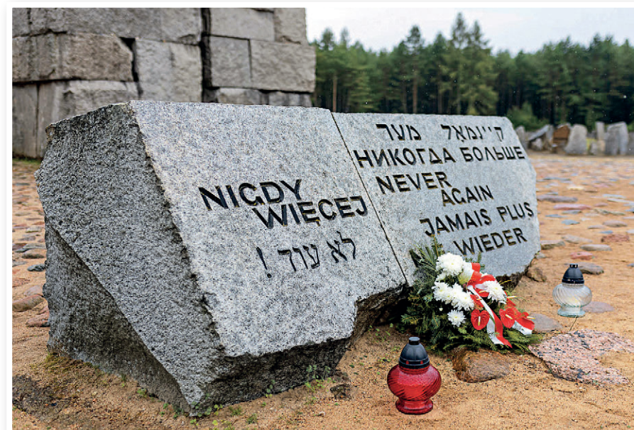
Kluczowe przesłanie w siedmiu językach: polskim, hebrajskim, jidysz, rosyjskim, angielskim, francuskim i niemieckim.

Na terenie byłego obozu zagłady w Treblince odsłonił symboliczny kamień z nazwą naszego miasta. To hołd dla zamordowanych w czasie wojny mieszkańców gminy Marki