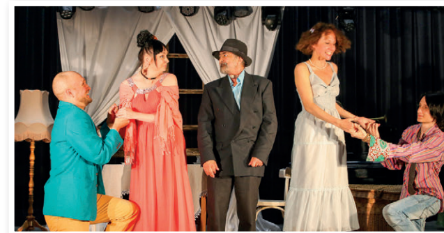
Śluby Panieńskie w wykonaniu Teatru Falenica