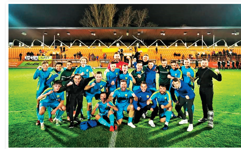
Radość po niespodziewanym zwycięstwie z Hutnikiem Warszawa

Kibice pierwszej drużyny Marcovii przeżywają w tym sezonie prawdziwy „rollercoaster”. Na szczęście piłkarze są już na fali wznoszącej.