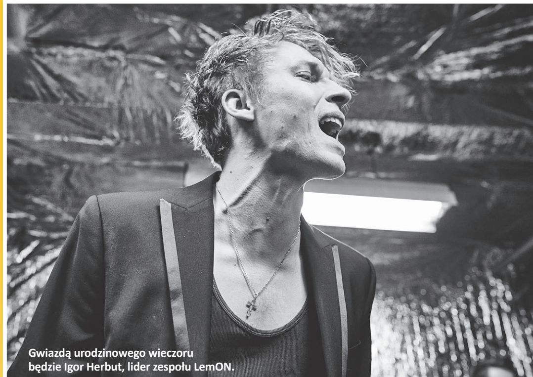
Gwiazdą urodzinowego wieczoru będzie Igor Herbut, lider zespołu LemON.