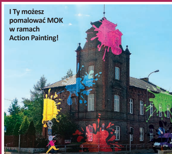
I Ty możesz pomalować MOK w ramach Action Painting!

Zajęcia muzyczne, break dance, zapisy do sekcji, a także... nieskrępowane chlapanie farbą – takie rzeczy już 9 września.