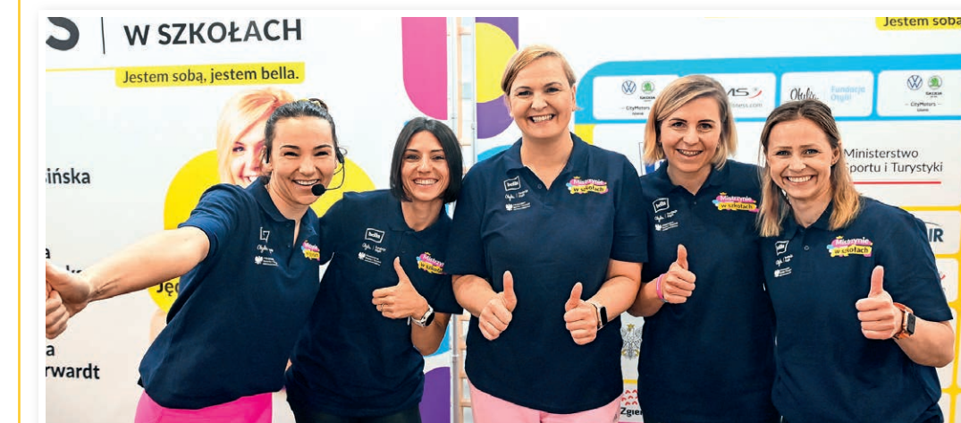
Gwiazdy sportu zachęcają do aktywności

Złota medalistka olimpijska poprowadzi zajęcia dla dziewcząt.