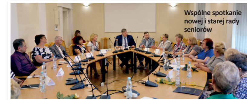
Wspólne spotkanie nowej i starej rady seniorów