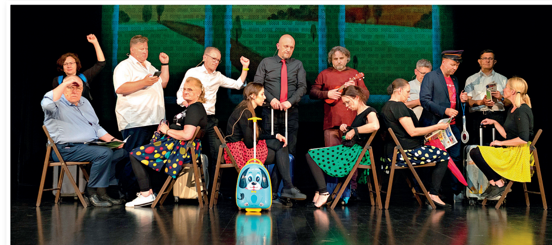
Na Scenie MCER dla dzieci zagrają mareccy samorządowcy

Bezpłatne wejściówki znajdują się na mokmarki.pl oraz w kasach MOK i MCER.