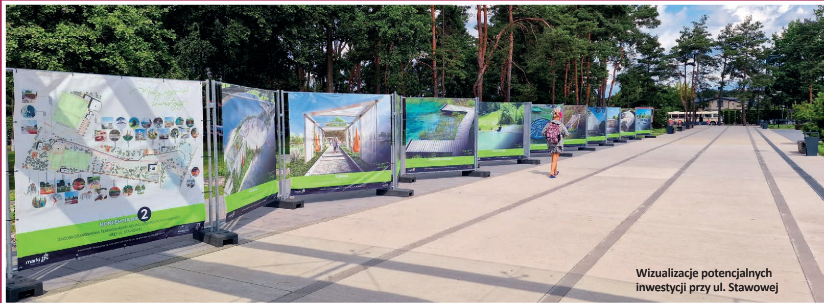
Wizualizacje potencjalnych inwestycji przy ul. Stawowej