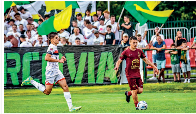
Kibice są dwunastym zawodnikiem Marcovii.

Niezbyt łaskawy terminarz rozgrywek sprawił, że w drugiej kolejce