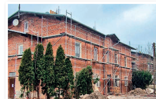
Kamienica przy Barskiej