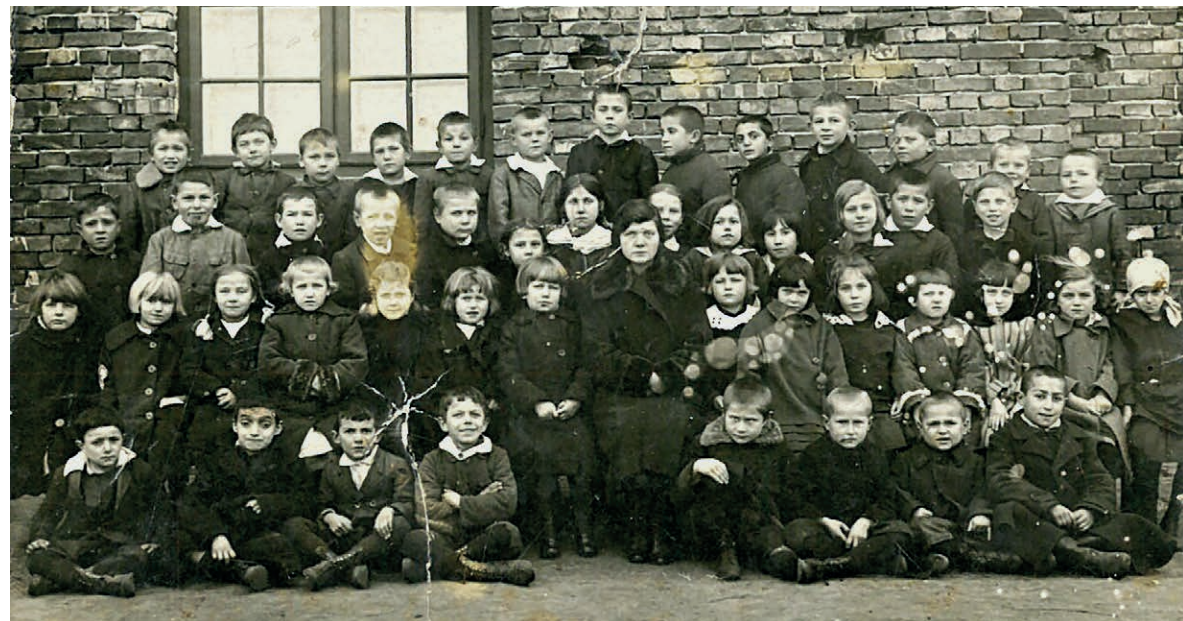
Uczniowie szkoły elementarnej. Lata 20. ubiegłego stulecia. W tle budynek szkoły, czyli obecnej siedziby MOK.