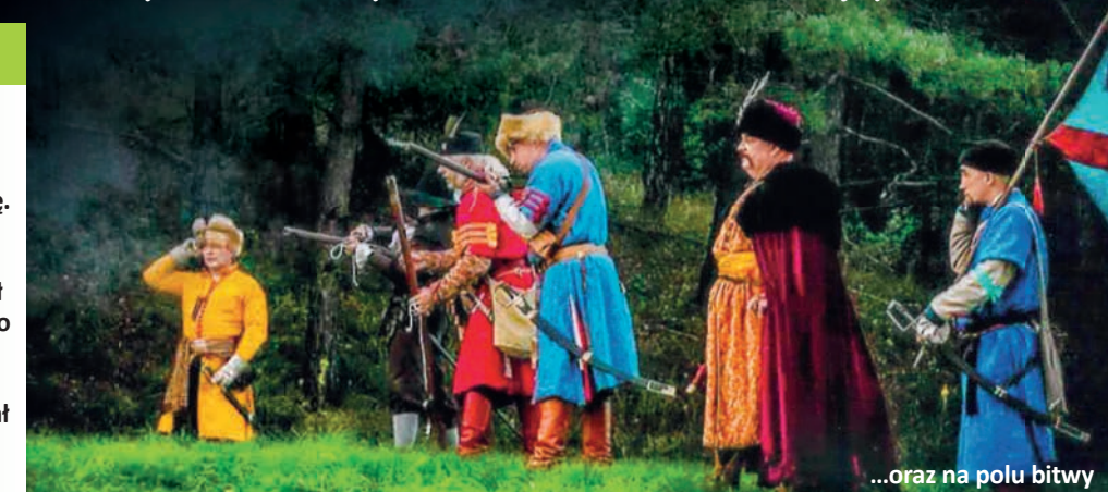
...oraz na polu bitwy

Oczywiście! Jan Sobieski w 1656 roku, będąc chorążym koronnym, w czasie Potopu Szwedzkiego, na czele posilków tatarskich bronił Szwedom dostępu do Warszawy właśnie na terenie dzisiejszych Marek.