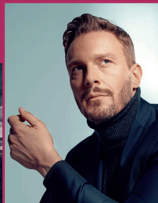
Andrzej Piaseczny i Sławomir Uniatowski są gwarantami znakomitego wieczoru, pełnego pięknych wzruszeń.

W styczniu będzie można u nas usłyszeć Andrzeja Piasecznego, a w lutym – Sławka Uniatowskiego. Ten pierwszy zagrał w MCER w październiku 2021 roku. Teraz powraca z najnowszym repertuarem, skierowanym do kameralnych sal z klimatem. Andrzej Piaseczny – Akustycznie wystąpi na Scenie MCER 15 stycznia o godz. 18.00. Będzie to szczególne wydarzenie, zapewniające znakomitą atmosferę i kontakt z widzami. Usłyszymy najbardziej znane utwo-