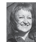
KATARZYNA KOZŁOWSKA fotograf

Choinka w MCER, przyozdobiona przez mieszkańców. Niech będzie symbolem nie tylko pięknych, świątecznych dni, ale również lepszego, przyszłego roku.