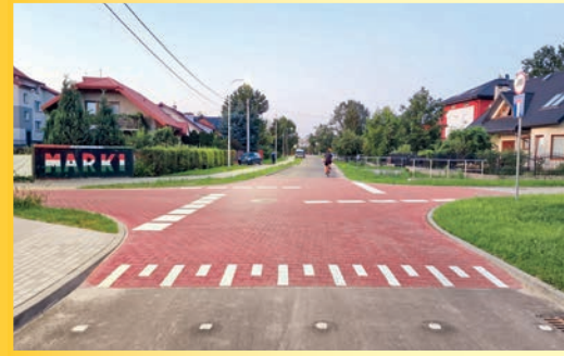
Koszalińska róg Kołobrzeskiej

Niemal 6 km – tyle w tym roku przybyło nowych dróg w naszym mieście. Czy to dużo? To tak, jakbyśmy w prostej linii ułożyli nawierzchnię w Alei Piłsudskiego od węzła trasy S8 do ul. Granicznej. Zrealizowaliśmy prace (lub je kończymy) na 19 ulicach lub ich odcinkach.