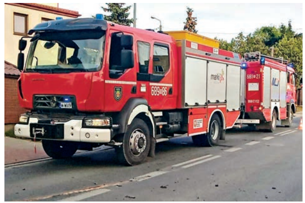
Na początku przyszłego roku minie 10 lat od reaktywacji Ochotniczej Straży Pożarnej w Markach. Dziś trudno byłoby sobie wyobrazić nasze miasto bez tej formacji... Str. 4