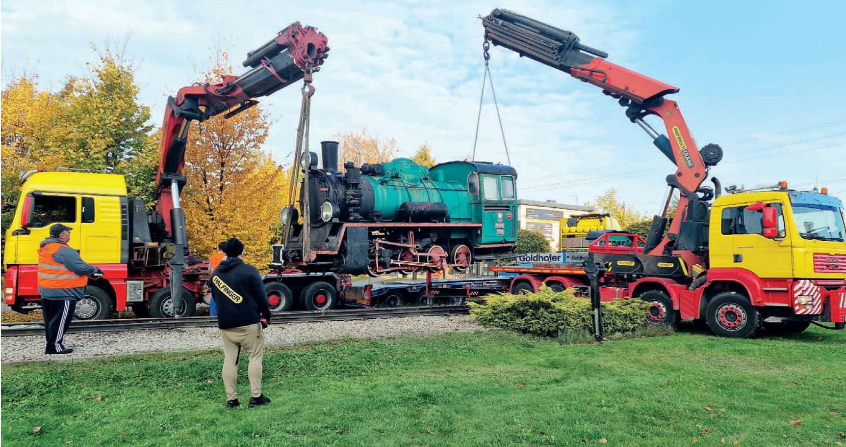
Kilkugodzinna operacja załadunku parowozu na tiry zakończyła się sukcesem. Do jej powrotu na elektronicznym ekranie ratusza będzie wyświetlał się napis: „Pojechałam na gruntowny remont. Wasza Ciuchcia”.