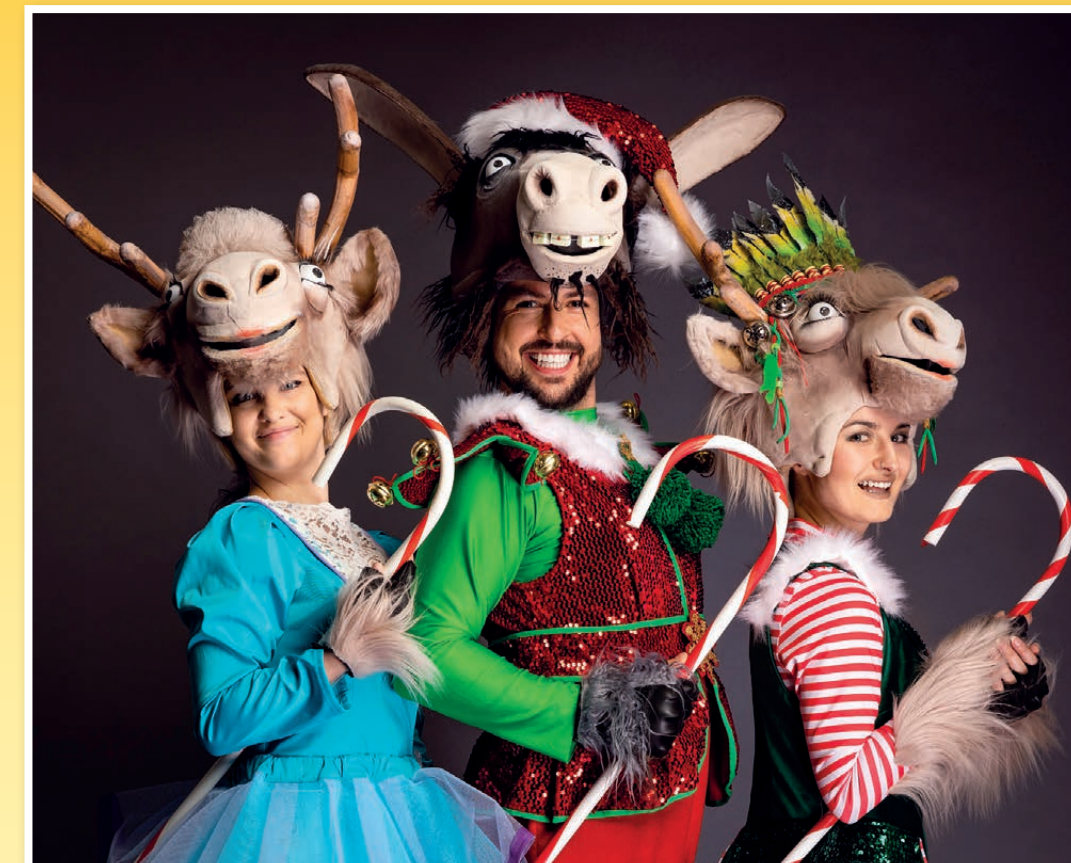
Przesympatyczne renifery zawiadną Sceną MCER

„Kopyta w górę!” – to najnowszy spektakl zimowy Teatru Kultureska, który dwukrotnie zagramy dla naszych najmłodszych widzów z okazji Mikołajek.