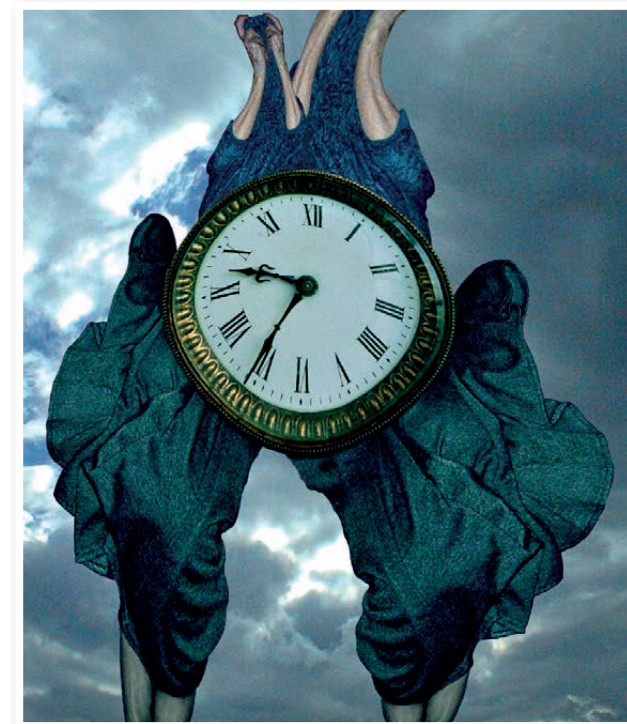
Jedna z prac Zdzisława Beksińskiego, którą będzie można zobaczyć w MOK.