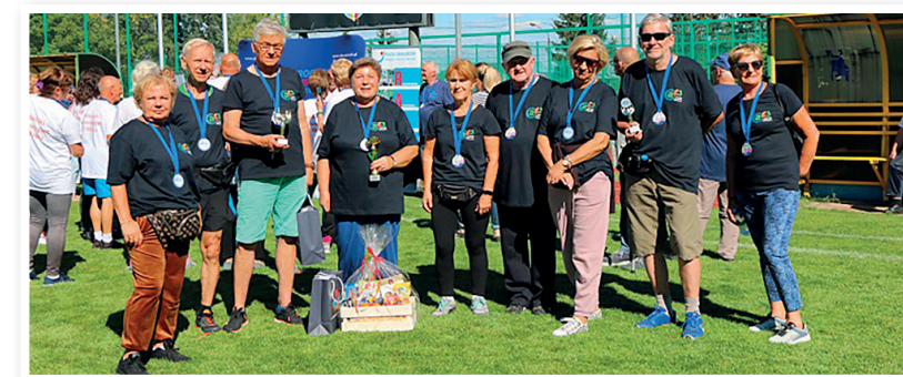
Reprezentacja mareckich seniorów w Serocku.

Z kolei na zajęcia Aqua Senior (płatne) zaprasza Mareckie Centrum Edukacyjno-Rekreacyjne. Dla posiadaczy Mareckiej karty Mieszkańca przewidziane są zniżki. Zapraszamy!