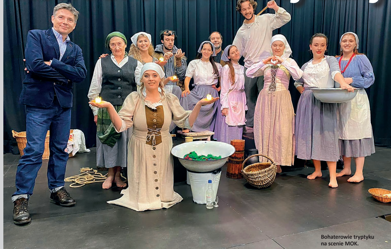
Bohaterowie tryptyku na scenie MOK.

Kieruj się do sfery uczuć i na nowo odczytaj utwory Adama Mickiewicza