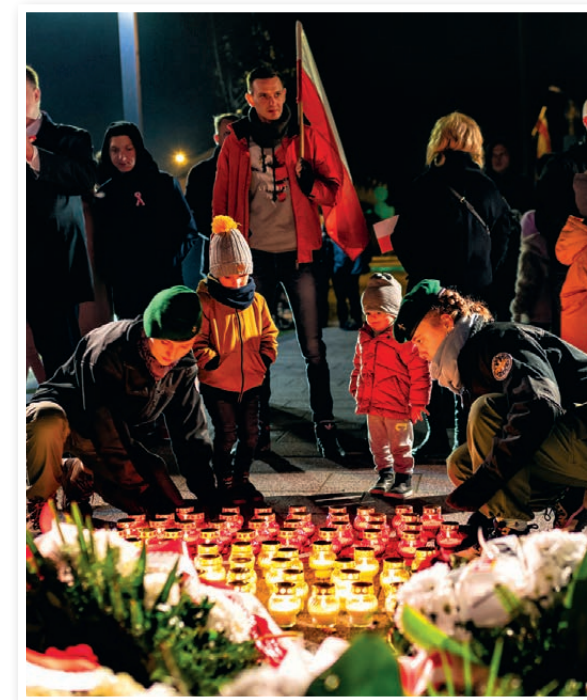
Układanie biało-czerwonej flagi ze zniczy.

O godz. 18.00 spotkamy się na Skwerze Pamięci Narodowej. Tam wspólnie odśpiewamy Mazurka Dąbrowskiego i złożymy kwiaty. Ułożymy też biało-czerwoną flagę ze zniczy. Po części oficjalnej tradycyjnie zaprosimy Państwa na ciepły posiłek. W tym roku na terenie targowiska będziemy serwować wojskową grochówkę. Do zobaczenia 11 listopada!