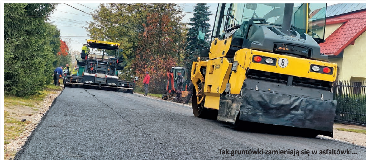
Tak gruntówki zamieniają się w asfaltówki...

W tym roku mamy już na koncie kilka podobnych realizacji. W 2022 r. ułożyliśmy nakładki asfaltowe w ulicach: Długosza, Podgórskiej i Piotrkowska. Zrealizowaliśmy też odcinki