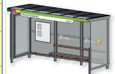
Tak będą wyglądać mareckie wiaty.