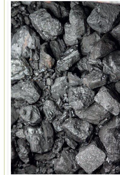
Węgiel – jedno z najbardziej poszukiwanych obecnie źródeł ciepła.