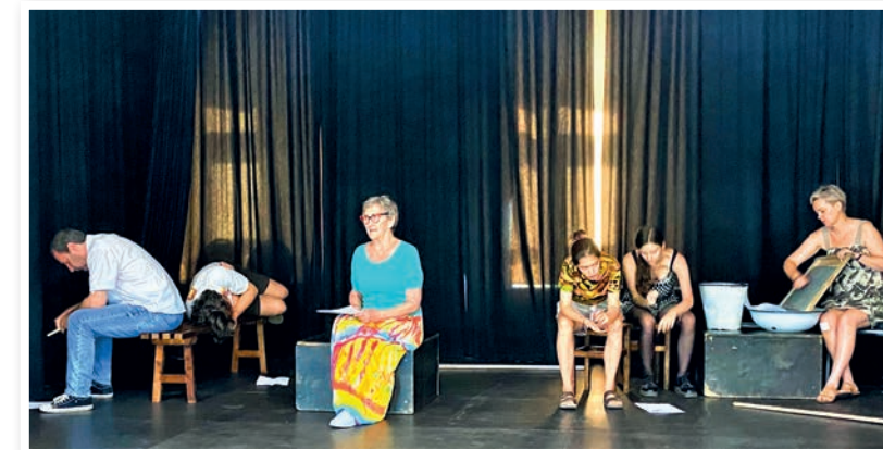
Próba przed premierą Tryptyku Romantycznego.

10 września (godz. 19.00) zapraszamy na pierwszą premierę – czytanie performatywne „Jak czarta oszukać”, czyli oryginalną adaptacją sceniczną „Pani Twardowskiej” i „Tukaja”. Forma czytania performatywnego z elementami improwizacji to wyjątkowe spotkanie z tekstem poetyckim i unikatowy pokaz pracy aktora, który odsłania