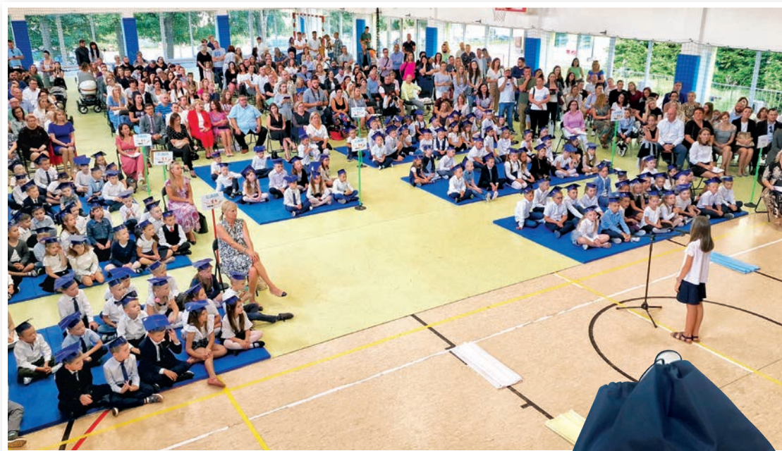
W tym roku do pierwszych klas pójdzie 735 uczniów...