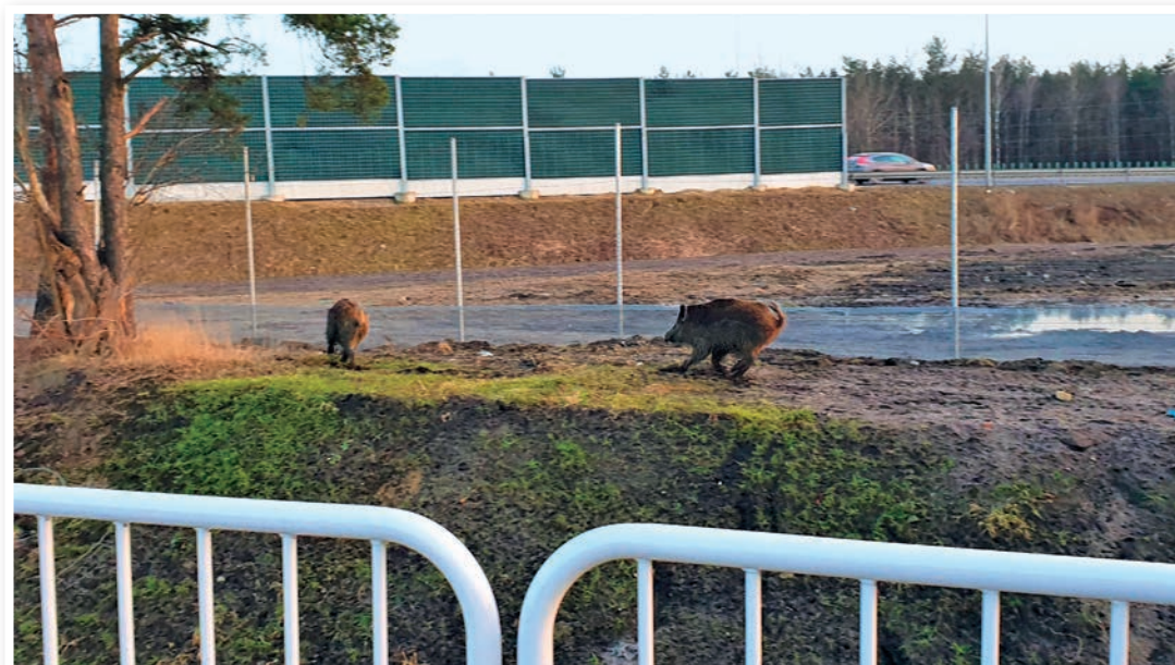
Dziki na spacerze wzdłuż obwodnicy Marek.