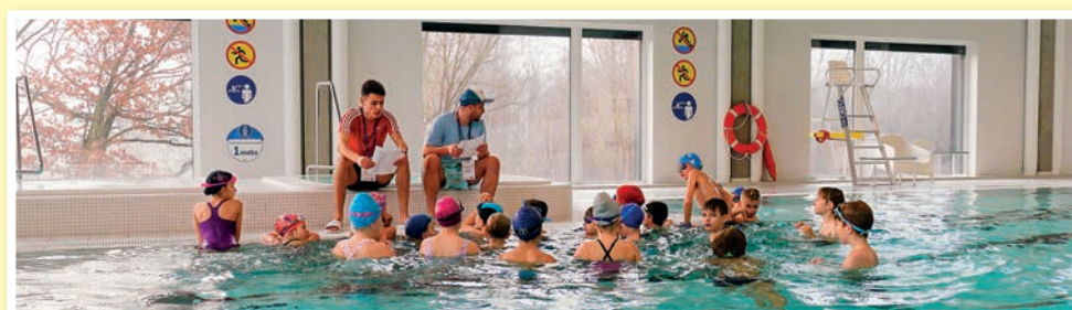
Lekcja na wodzie, czyli nauka pływania w MCER.

Zajęcia w wodzie startują od 17 września po zakończonej przerwie technologicznej na naszej pływalni. Wszelkich informacji o zapisach i zajęciach można zasięgnąć w kasach MCER telefonicznie: tel. 22 100 23 41 lub mailowo: kasy@mcer.pl . Zapraszamy!