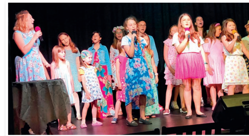
Ubiegłoroczny finał Artystycznych Marek na Scenie MCER.