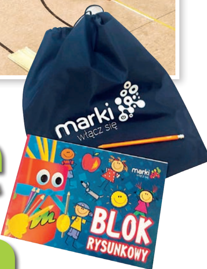
...a każdy z nich otrzyma szkolny worek.