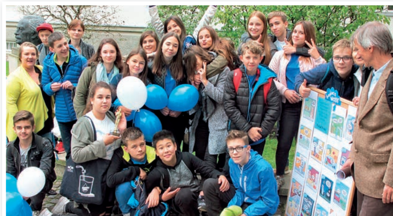
Szkolna elita. Pierwsi w Polsce, drudzy na świecie. Gratulujemy ekipie Polish Drops. Trzymajcie tak dalej!

Mareccy uczniowie, znani pod nazwą Polish Drops, od samego początku szli jak burza. Kiedy dołączyli do globalnego przedsięwzięcia „Badacz Wody”, osiągnęli wielki sukces, ponieważ awansowali do krajowego finału projektu, którego ogólnostanowowym celem jest ratowanie zasobów wody. Znaleźli się w piątce laureatów i 25 września uczestniczyli w finałowej gali w Pałacu Łazienkowskim, organizowanej przez Fundację GAP Polska. Tego dnia o pierwsze miejsce na podium walczyły: Szkoła Podstawowa nr 2 w Markach, Zespół Szkół w Palikówce, Publiczne Gimnazjum nr 1 w Pionkach, Gimnazjum nr 1w Socha-