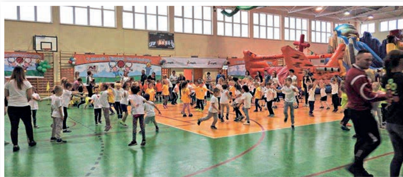
Zabawa na 102. Fantastyczna atmosfera, zaangażowane dzieci, radośnie kibicujący rodzice – tak wyglądała sobotnia impreza przedszkolaków w hali przy ul. Dużej.

Na koniec odbyło się uroczyste zgaszenie znicza olimpijskiego, podsumowanie olimpiady i oczywiście wręczenie nagród naszym bohaterom, na których czekały również słodkie upominki, puchary, medale.