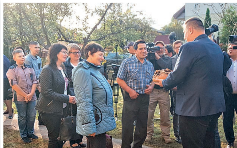
Koniec rozłąki. Staropolskie powitanie rodziny z Kazachstanu przed domem przy Pułaskiego.

– Dzisiejsza uroczystość jest świętem nie tylko dla Polaków powracających do naszego wspólnego domu czy – tak otwartej na apel Rady Ministrów o przyjęcie przez samorządy terytorialne repatriantów – społeczności Marek, lecz dla wszystkich, którzy w swoim życiu kierują się troską o Polskę – napisała w specjalnym liście premier Beata Szydło.