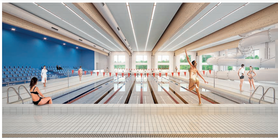
Nie tylko dla uczniów. Placówka przy Wspólnej będzie pracować dłużej niż do ostatniego dzwonka. To tu znajdą się m.in. basen, hala sportowa i sala koncertowa.

Zgodnie z duchem czasu. Szkoła przy Wspólnej ma być obiektem energooszczędnym. Dzięki temu koszty jej użytkowania będą znacząco niższe niż tradycyjnego.