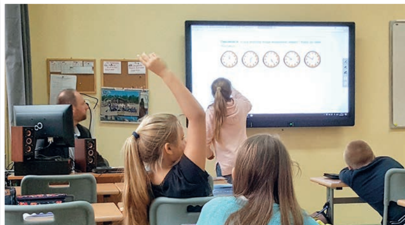
Lekcja nowoczesności. W sali w „dwójce” wiszą dwie tablice: elektroniczna i tradycyjna. Obie się przydają, ale uwagę uczniów przyciąga głównie ta pierwsza.

Kiedyś nauczyciel musiał stosować kredy różnego rodzaju, dziś – wystarczy jedno kliknięcie, by czerwony