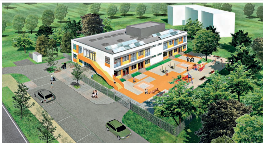
Okólna róg Słonecznej. Teren po domu komunalnym kilka lat czekał na zagospodarowanie. W przyszłym roku powstanie tam filia szkoły, a potem przedszkole o powierzchni wynoszącej około 1,1 tys. mkw.

– Wówczas filia „dwójki” przy Okólnej zostanie zmieniona w miejskie przedszkole – mówi Dariusz Pietrucha.